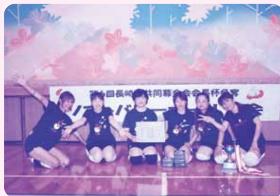
共同募金会長杯争奪 ソフトバレーボール大会