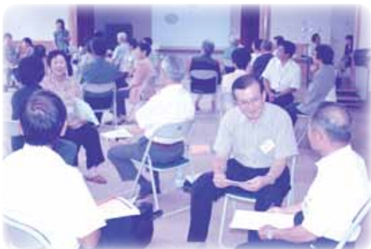
委員皆様の今後の活躍を期待しております