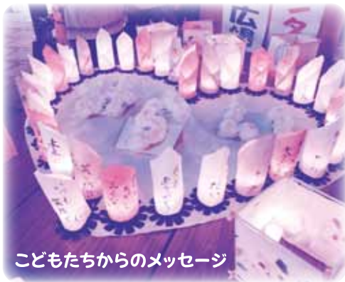
子どもたちからのメッセージ

会場内には、かき氷や焼き鳥などの販売コーナーや射的などのゲームコーナーをはじめ、24時間テレビチャリティ募金のブースも設置され、ちびっこはもとより大人も含め会場は大勢の人出で賑わいました。