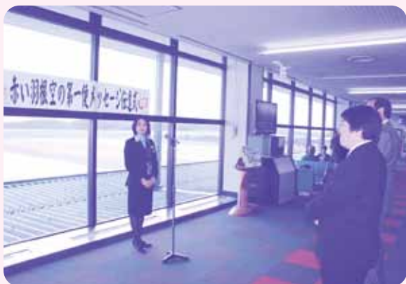
赤い羽根空の第一便 メッセージ伝達式