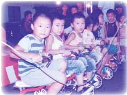
安全運転でお願いしますね♡