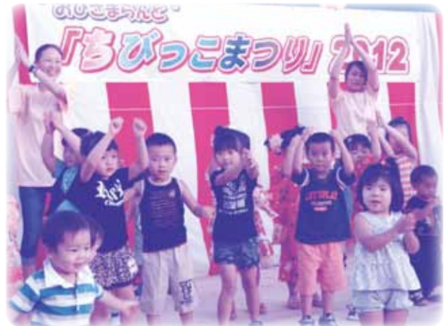
みんな、たいへんよくできました♪(パチパチ)

昨年度、雨に振り回されたこのまつりも、今年は天候にも恵まれ予定通り開催することができました。