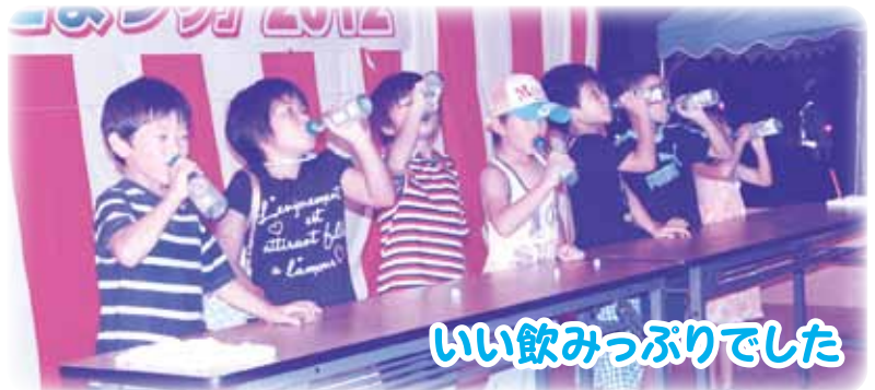
いい飲みっぷりでした

また、このイベントを企画運営にご尽力いただいた、ちびっこまつり実行委員会のメンバーをはじめ、運営スタッフとしてご協力いただいた多くのボランティアの皆様方に深く感謝申し上げます。