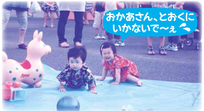
おかあさん、とおくに いかないで～え

会場内には、かき氷や焼き鳥などの販売コーナーや射的などのゲームコーナーをはじめ、24時間テレビチャリティ募金のブースも設置され、ちびっこはもとより大人も含め会場は大勢の人出で賑わいました。