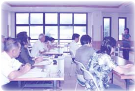
熱心に耳を傾ける受講者