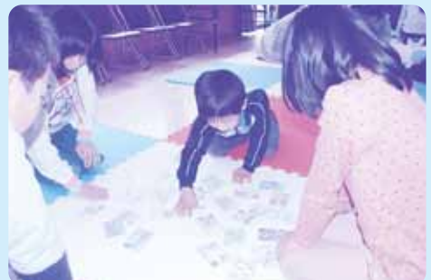
『対馬物語カルタ』は、年代問わず誰でも遊べ、対馬のことをもっと知ることができますね！