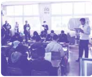
西小学校での公開授業

実践発表では、上対馬地区並びに美津島地区のふれあい学習推進協議会の代表よりそれぞれ発表が行われ、地元の学校や区を中心として、地域の特色を生かした体験活動や環境美化活動、住民との交流事業など報告が行われました。