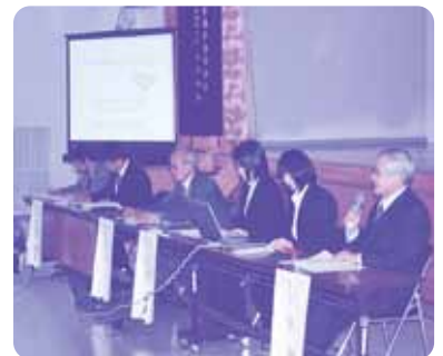
ふれあい学習事業の実践報告 (上対馬・美津島)

実践発表では、上対馬地区並びに美津島地区のふれあい学習推進協議会の代表よりそれぞれ発表が行われ、地元の学校や区を中心として、地域の特色を生かした体験活動や環境美化活動、住民との交流事業など報告が行われました。