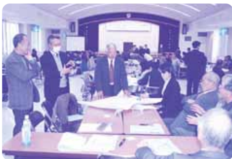
熱心な意見が飛び交ったグループワーク

今回の研修やふれあい学習事業を通じて福祉教育の推進と、誰もが安心して暮らせる福祉の対馬(しま)づくりにつながって欲しいと思います。