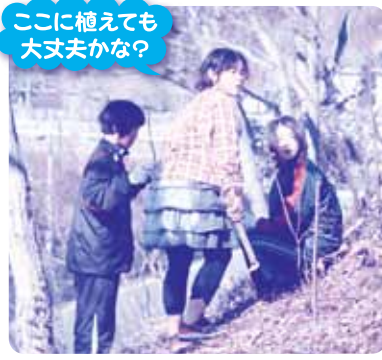
ここに植えても大丈夫かな?

あらかじめ、会員によって伐採・整備された山林に、参加者はそれぞれツツジの苗木を抱えて入り、地中の石や木の根に悪戦苦闘しながらも、