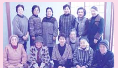
次回も皆さんの参加をお待ちしています!