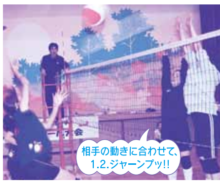
相手の動きに合わせて、1.2.ジャンプツ!!