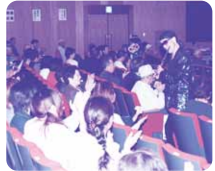
間近で聴く演奏に大感激

最後には、大会宣言(案)が朗読され、来場された皆様の大きな賛同の拍手で大会は閉会しました。