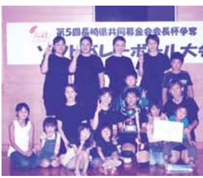
優勝 ファブリーズチームの皆さん