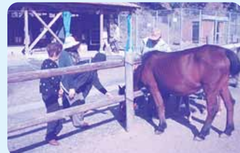
童心に帰って馬とふれあいました

今年度は、観光バスによる美津島町の名所である浅茅パールブリッジの見学や対州馬とのふれあい、また老人福祉施設「対馬の杜」の視察など、ゆったりと交流を図りました。