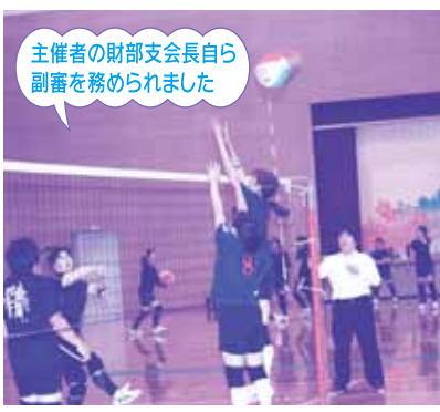
主催者の財部支会長自ら副審を務められました