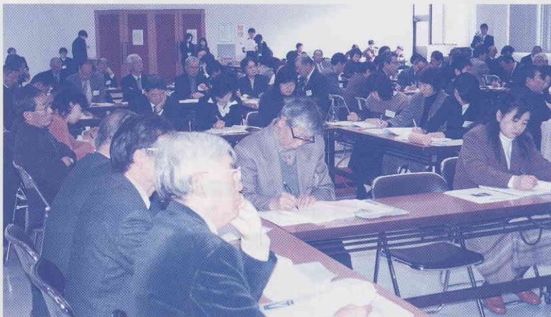
▲参加いただいた皆さん、大変お疲れ様でした。

して、計画や実行することで、学習を終わるのではなく、その後の「ふりかえり」が大切との講演に、参加者みなさん真剣に耳を傾けていました。 終日の研修会ではありましたが、このセミナーを通して学んだことを、今後、対馬の福祉教育やふれあい学習に生かしていただきたいと思います。