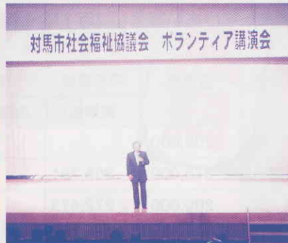
▲ボランティア講演会