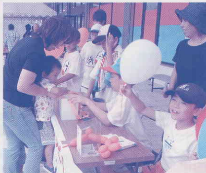
▲24時間チャリティー事業