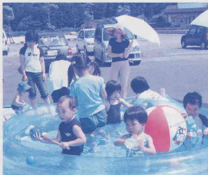
▲子育て支援事業(おひさまランド)