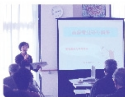
長崎県消費生活センター職員による講義

今回の研修会には、地域福祉活動の良き協力者である、民生児童委員や単位老人クラブ会長等の参加を頂きました。最近のこうした悪質商法の実態を知り、その対策を学習することによって、市民の消費者トラブル被害を防止することにつながれば幸いに思います。