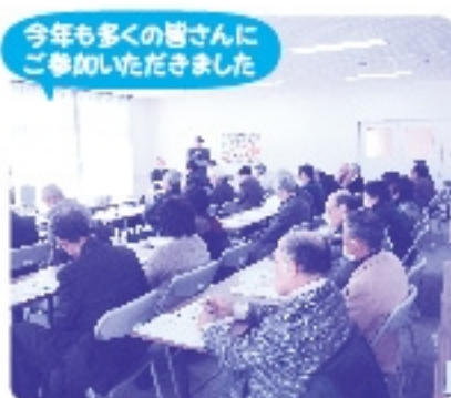
今年も多くの皆さんにご参加いただきました