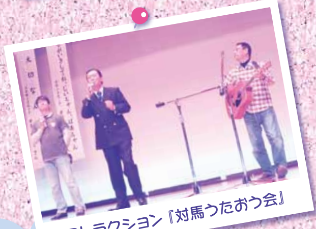
アトラクション『対馬うたおう会』