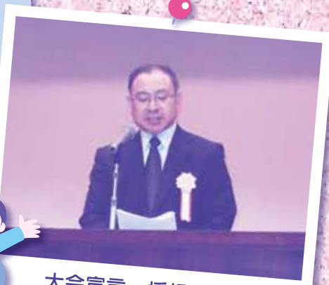
大会宣言 採択される