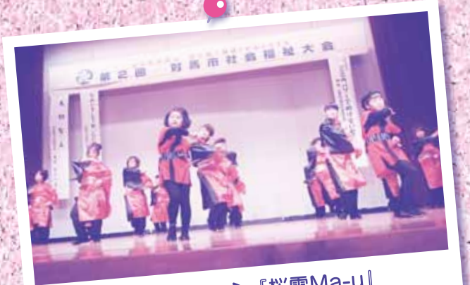
アトラクション『桜雪Ma-u』