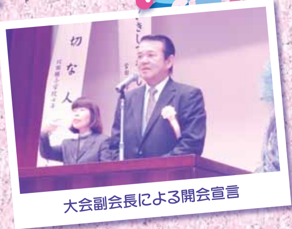
大会副会長による開会宣言