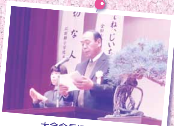
大会会長による挨拶