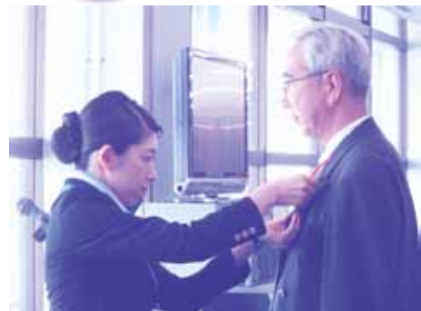
赤い羽根空の第一便メッセージ伝達式