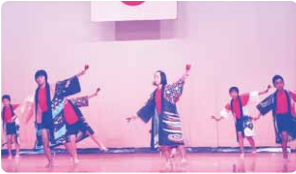
塩浦小オリジナル 塩ラン節の披露