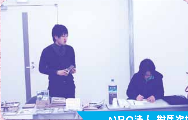
NPO法人 対馬次世代協議会 ～コノソレ～