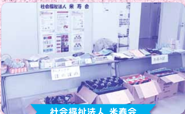
社会福祉法人 米寿会