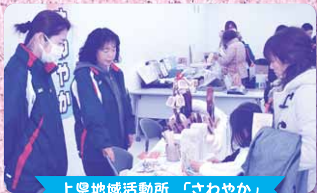
上県地域活動所「さわやか」