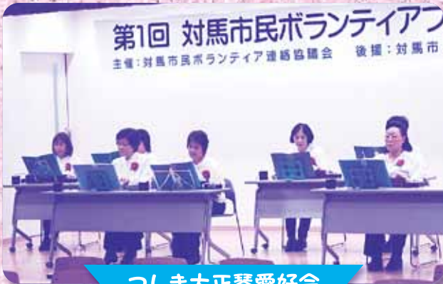
つしま大正琴愛好会