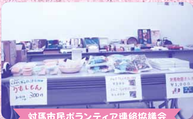
対馬市民ボランティア連絡協議会

イベント内容はブース展示・バザー・出店コーナー・ステージです。また、同会場で福祉作品の展示・表彰式を行いました。ご協力頂いたNPO・ボランティア団体をはじめ、ご参加頂いた方々へ厚く御礼申し上げます。