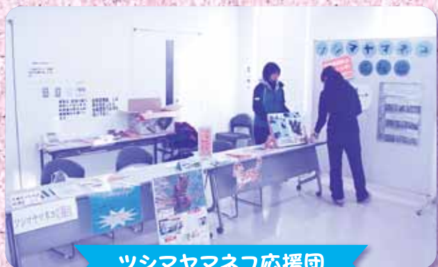
ツシマヤマネコ応援団