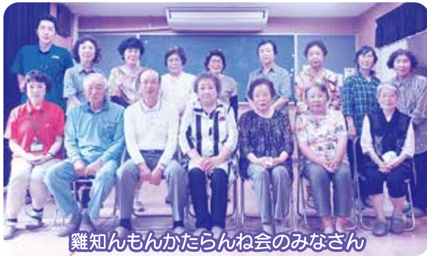
雞知んもんかたらんね会のみなさん