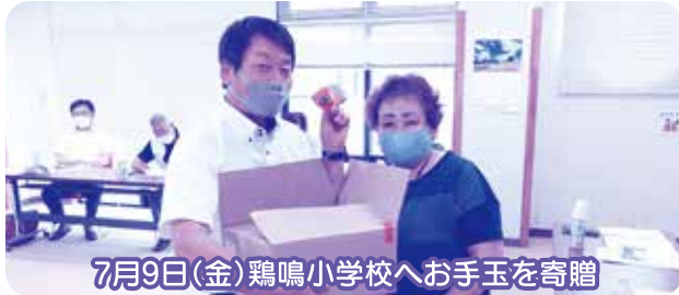
7月9日(金) 鶏鳴小学校へお手玉を寄贈