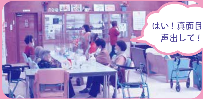
11:55 パタカラ体操後の食事と休憩