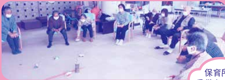
13:00 カラオケ・レク・看護師による 機能訓練指導等