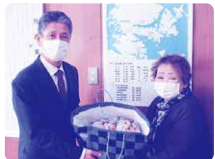
美津島北部小学校