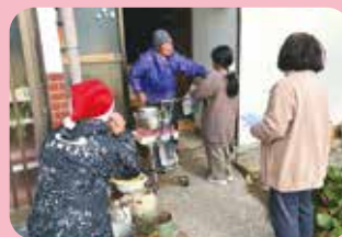
地区内異世代交流