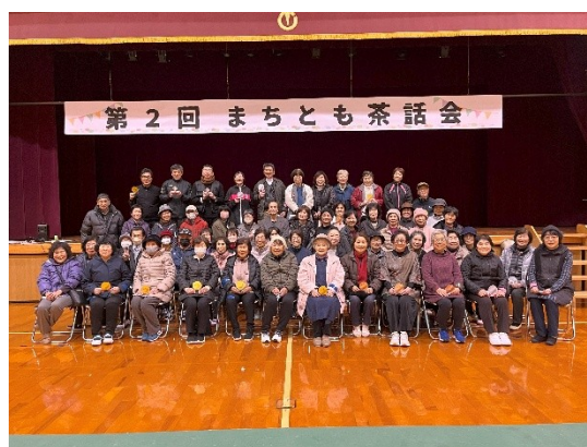
ささえあい(愛)の地域づくりを目指して！ 【令和7年3月開催 まちとも茶話会】